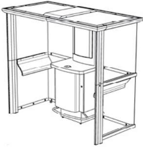
MEZZO (4-5 Personen) 2200 x 1215 x 2165 mm*