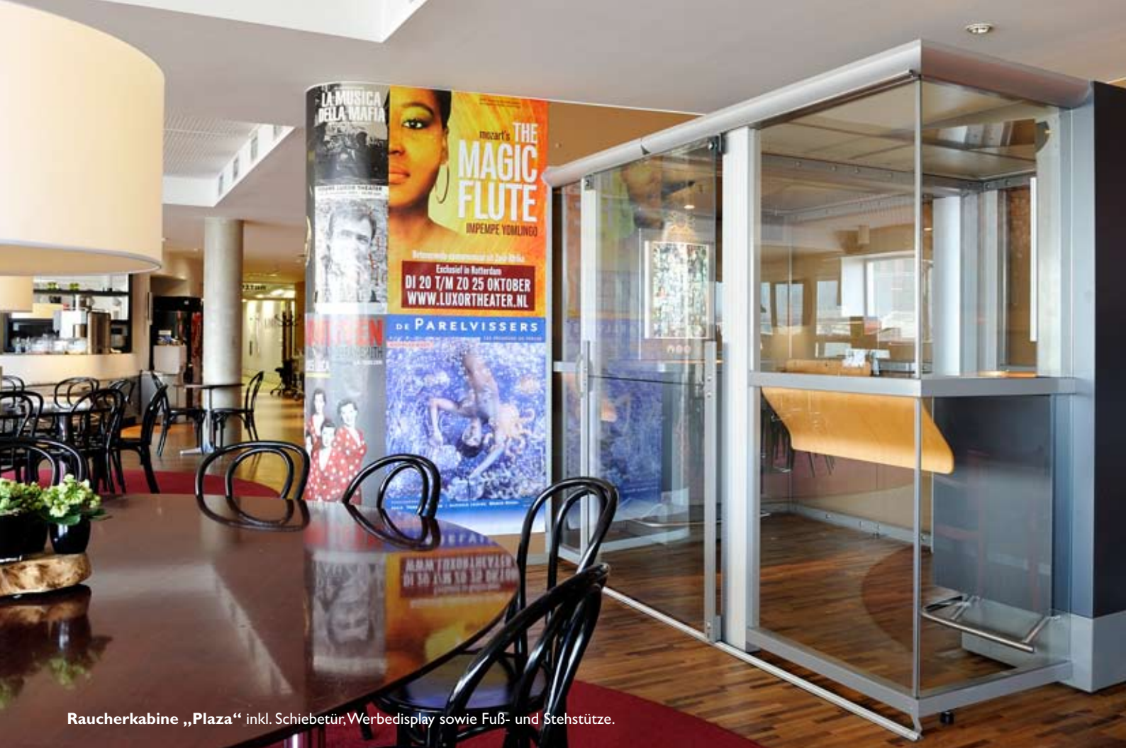
Raucherkabine „Plaza“ inkl. Schiebetür, Werbedisplay sowie Fuß- und Stehstütze.