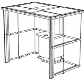
ESPACE (6-7 Personen) 2200 x 1715 x 2165 mm*